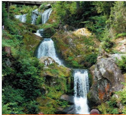
Parque Natural de las Cascadas de Triberg

tural donde se recrea las granjas típicas de la región y muestra las tradiciones locales en arquitectura, artesanía, etc. Visita guiada incluida. A continuación, visitaremos el Parque Natural de las Cascadas de Triberg , donde se hallan los saltos de agua más espectaculares de Alemania y en el cual numerosas ardillas acuden a comer de la mano de los turistas. Almuerzo en Restaurante. Por la tarde nos detendremos en Schiltach preciosa villa medieval muy bien conservada con multitud de casas con entramado de madera.