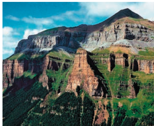
Parque de Ordesa y Monte Perdido

Excursión por el corazón del Pirineo Aragonés como es el Parque Nacional de Ordesa y Monte Perdido maravilla de la naturaleza con sus bellísimas cascadas, impresionantes sierras y lagos, al que accedemos desde Torla mediante vehículos autorizados para adentrarnos en el Parque, donde a través de rutas bien señalizadas y de fácil acceso podrán pasear entre inmensos bosques y recorrer a su gusto. Por la tarde ascenderemos al límite con el Pirineo francés llegando a las estaciones de alta montaña de Astún y de Candanchú , haciendo una parada previa en Canfranc para admirar la gran edificación de su estación, ahora en desuso, pero que fue el complejo ferroviario más importante del primer tercio del siglo XX.